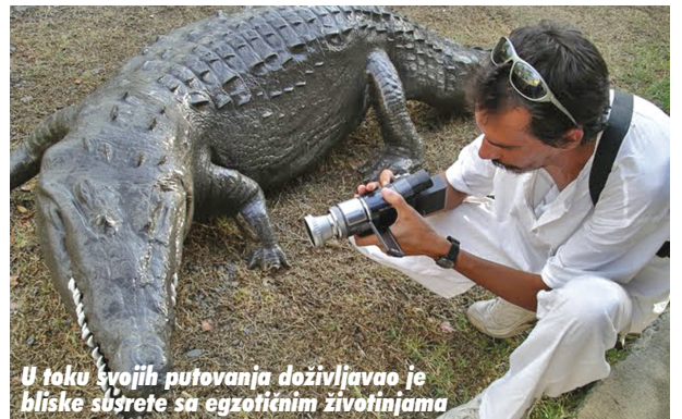
U toku svojih putovanja doživljavao je bliske susrete sa egzotičnim životinjama