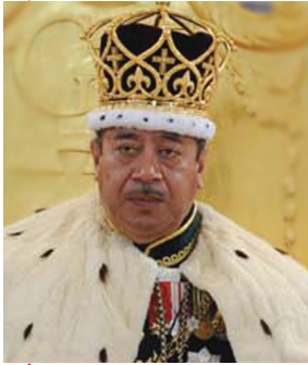
Kralj George Tupou V. poklonio je timu Synergy Moon otok za lansiranje robota

Put koji su mnogi nazvali „putovanje stoljeća“ kreće sa otoka Eua, najjužnijeg otoka pacifičke Kraljevine Tonge. Kralj ove države, George Tupou V, timu „Synergy Moon“ dodijelio je na poklon otok Eua na kome će se vršiti i lansiranje robota „Tesla“ na Mjesec.